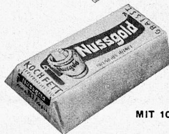
MIT 10% BUTTER