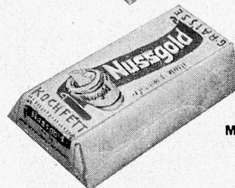
MIT 25% BUTTER