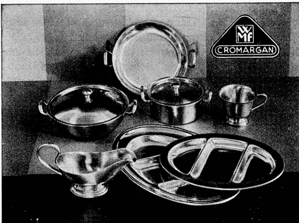
WALTER E. FRECH & CO. LUZERN GROSSKÜCHENEINRICHTUNGEN Tel. 298 40