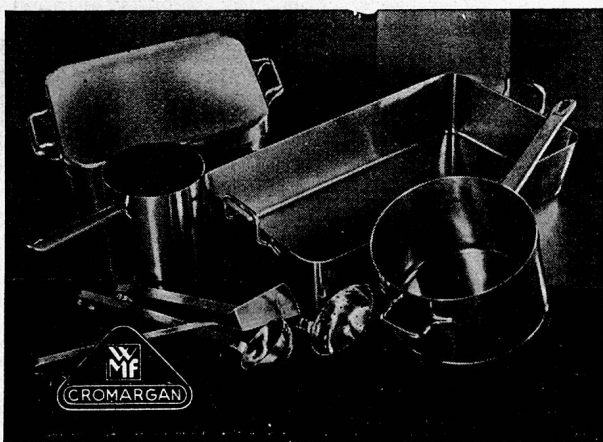
Kochgeschirre, Küchen- und Tafelgeräte aus Chrom-nickelstahl für Anstalten und Spitäler liefert als Spezialität seit vielen Jahren die Firma