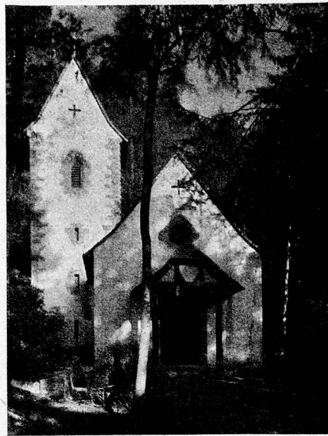
Kapelle auf Bürgenstock

klang. So bin ich von einer «festgebundenen Hausmutter», deren Wunsch es schon lange war, den Bürgenstock nicht nur immer von Ferne zu sehen, gebeten worden, im Fachblatt ihren herzlichen Dank an den «regsamen, vorsorglichen Vorstand» zu veröffentlichen und ihrer grossen Freude Ausdruck zu geben, dass durch die bevorstehende Tagung Vorsteherehe-