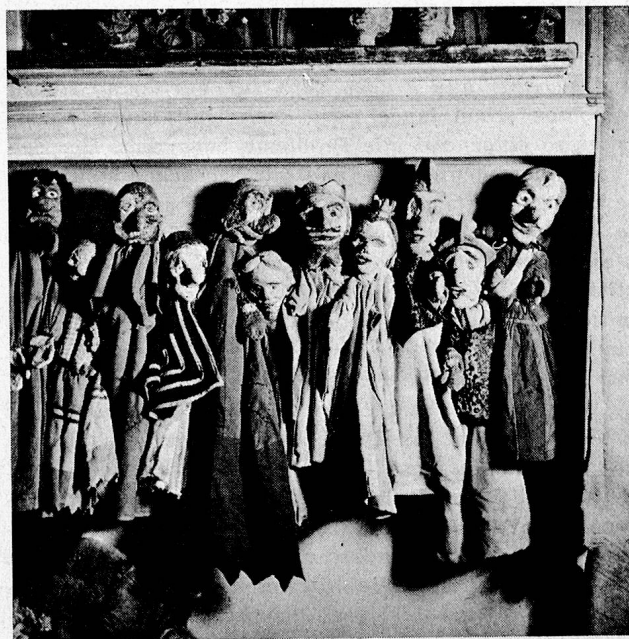
Nach dem Spiel alle friedlich vereint