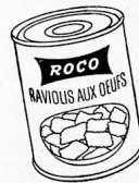
Schmunzelnd führt Signor Ravioli

ein wohlgenährtes Säuli heim. Zartes Fleisch