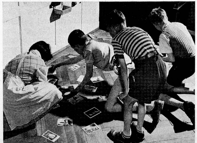
Spiel und Unterricht mit Ansichtskarten

Dies wird vor allem dann klar, wenn ein neuer Schüler eintritt, der neben seiner Geistesschwäche noch alle Merkmale einer Schwererziehbarkeit aufweist. Er hat seine schulische Laufbahn vielleicht in der normalen Primarklasse begonnen, wurde nach mehr oder minder langem Hin und Her in die Spezialklasse versetzt, um schliesslich in der Hilfsschule zu landen. Mit positiven Leistungen konnte er bis jetzt nirgends die Aufmerksamkeit auf sich lenken. So gewöhnte er sich daran, jene Mittel zur Gewinnung der Beachtung zu gebrauchen, die auch dem wenig Begabten zur Verfügung stehen: er wurde frech und laut, ein schwarzes Schaf. Seine Leistungen in den einzelnen Fächern konnten von den Mitschülern wahrhaftig nicht bewundert werden; aber seine Art, Unfug zu treiben, musste bewundert werden. Die