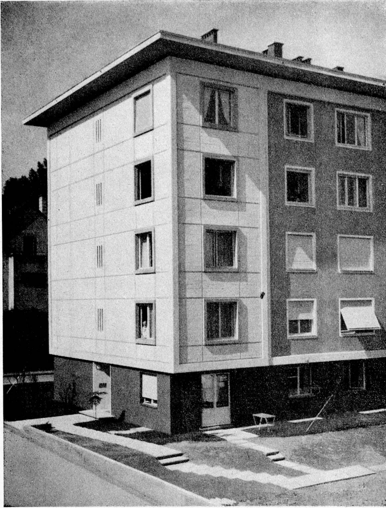
Alters-Wohnheim an der Hechtgasse in Basel (aus «Pro Senectute»)

Schaden nimmt. Nun begreifen wir auch, warum so viele Greise sich in Altersheimen so verloren vorkommen, warum sie so glücklich wären, wenn man ihnen nur einen kleinen Teil ihrer persönlichen Möbel, ihres an Erinnerungen reichen Hausrates liesse. Unter der Knute allzusehr ordnungsliebender Pflegepersonen ist schon manchen alten Menschen der letzte Rest Lebensfreude entschwunden.