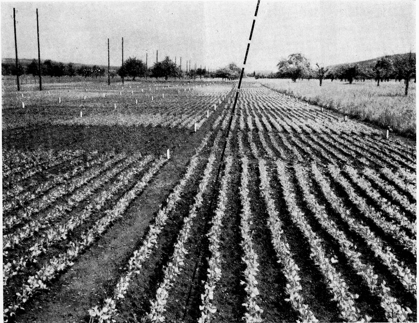
Erbsen-Versuchsfeld in Frauenfeld

Seit Jahrzehnten können wir in den eigenen Versuchsgärten das Gedeihen, den Ertrag und die Qualität der verschiedenen Erbsensorten laufend verfolgen und verbessern. Darum sind die Hero-Gourmet-Erbsen so einzigartig in ihrer Feinheit und Nährkraft. Unsere Versuchsgärten lehren uns die rationellste Bewirtschaftung der Plantagen. Wir können Ihnen deshalb die besten Erbsen so vorteilhaft anbieten.