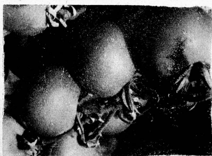
Tomate Vatter 416 wurde an der SLA Luzern mit einer Goldmedaille ausgezeichnet.

Karotten sind vom Speisezettel nicht wegzudenken. Ins warme Frühbett kann man die bekannten Treibsorten «Vertou» und «Phänomen, Stamm Vatter» aussäen. Für Freiland ist besonders ertragreich «Touchon» (Markthallen) und als Ganzjahressorte befriedigt immer «Nantaise, Stamm Vatter». Bei Juliaussaat kann sie auch eingelagert werden. Für den Wintervorrat ebenfalls ausgezeichnet ist die stumpfe Sorte «Berlikumer», nicht zu vergessen die goldgelben Pfälzer Rüebli.