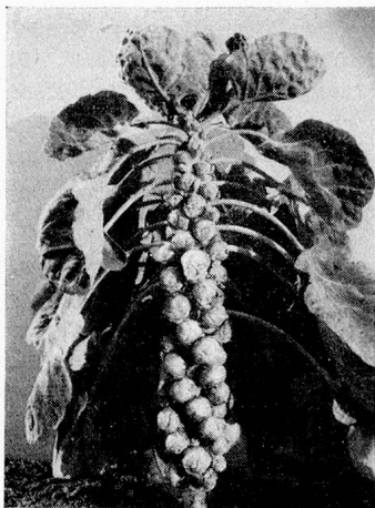
Rosenkohl Berner Markt, Stamm Vatter, die Sorte für langdauernde Winterernte.

Als Stangenbohne überbietet die neue Sorte «Vatters Ernteseegen» an Ertrag sogar die sehr reich tragende Sorte «Füllhorn». Ein amtlicher Versuch stellte einen