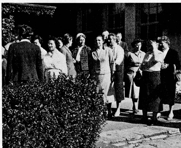
Die Schweizer Reisegruppe nach einer Besichtigung