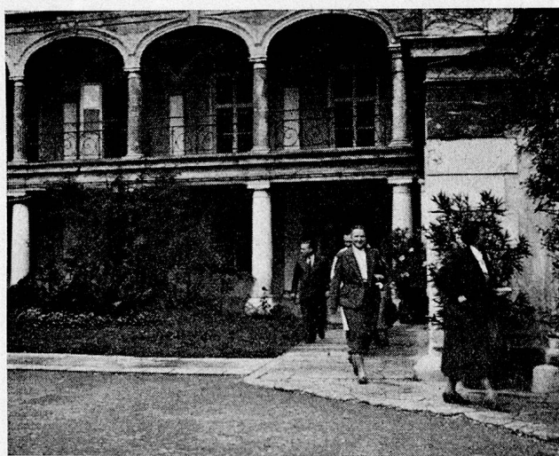
Heim für bildungsfähige Geistesschwache in Oberlanzendorf

Des Nachts amten nach einem entsprechenden Ablösungsrhythmus diensttuender Erzieher als Nachtwachen. Ihnen steht, verbunden durch eine Türe mit dem 20—30plätzigen Schlaflsaal, ein unpersönliches Dienst-