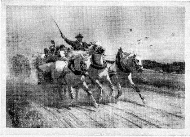
Aus der Pro Juventute-Kartenserie 1958 Nach dem Gemälde von Rudolf Koller