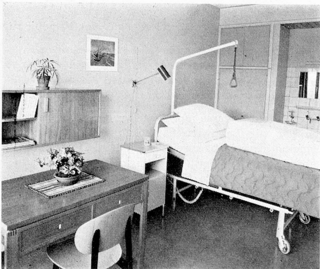
Im Krankenzimmer sind die Betten mit einer elektrischen Spezialvorrichtung versehen, womit der Patient die Liegefläche selbst heben oder senken kann.

Zwar wurde das zu errichtende Pflegeheim von Anfang an als wirtschaftlich selbsttragend konzipiert. Es war nie, und wird nicht vorgesehen, staatliche Beiträge an den Betrieb des Heimes anzubegehren. Dagegen erwies sich die Leistung eines Staatsbeitrages an die Errichtungs- und Einrichtungskosten des Heimes als unumgänglich, wollte man die Pensionspreise in einer tragbaren Grössenordnung halten. Denn nur so konnte ein wirklicher Dienst an unserem Volke erzielt werden. Wenn Regierungs- und Grossrat des Kantons Luzern auf dem Dekretsweg die Leistung eines Staatsbeitrages von 1 Million Franken gutschrieben, so geschah dies aus der Einsicht in die sozialpolitische Notwendigkeit eines solchen Pflegeheimes, der sich der Staat Luzern niemals zu entziehen trachtete, so wie aus dem Verständnis für