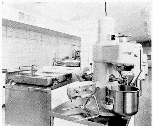
Die komfortable Küche ist mit der modernsten Ausrüstung versehen, und die vielen Maschinen erlauben ein rationelles Arbeiten.