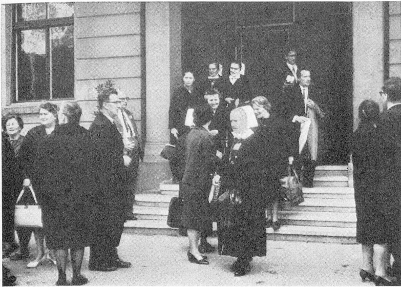
Schnappschüsse vom Kursaal Baden