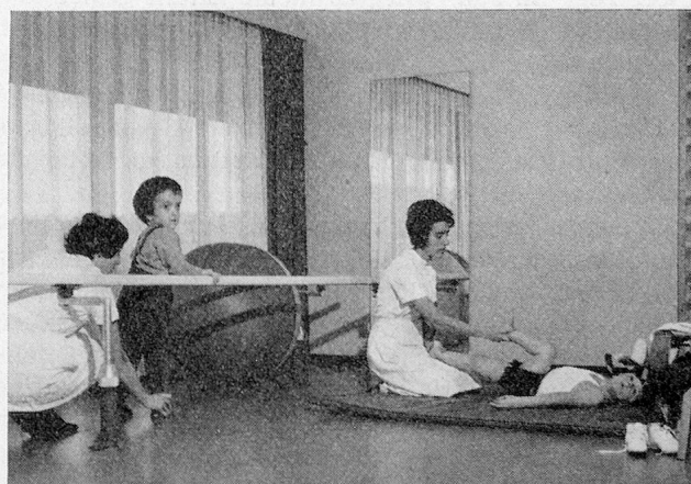
Physiotherapeutinnen im Schulheim Rossfeld Bern

Absolventen: Männer. Zweck: Ausbildung für den Dienst in Kirchgemeinden und Werken der Inneren Mission und Evangelischen Liebestätigkeit. Dauer: 3 1 / 2 Jahre. Beginn 1. April.