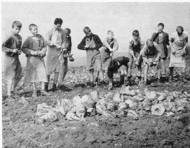
Heimbuben helfen beim Einbringen der Zuckerrüben-ernte. Erziehungsheim Effingen Aargau

Trotz der zum Teil sehr differenzierten Lohnklassensysteme bestehen — so stellten wir fest — eigentlich keine Grenzen nach oben. Es besteht unter den verschiedenen Kantonen ein eigentlicher Konkurrenzkampf, wie wir ihn in der Privatwirtschaft zur Genüge kennen. Deshalb wird allerorten mit Ueberstufungen versucht, sich bewährte Helfer zu erhalten oder neue zu gewinnen. Die Lohnspirale ist deshalb auch in den öffentlichen Verwaltungen ständig in Bewegung, was unsere Erhebungen natürlich recht mühsam gestaltete. Wir haben uns bemüht, die neuesten, z. T. erst nächstes Jahr gültigen Ansätze zu ermitteln. Um das Bild etwas zu differenzieren, haben wir uns auch um die Angaben für Zulagen und Abzüge (Kost und Logis) interessiert und sie in den Erläuterungen festgehalten.