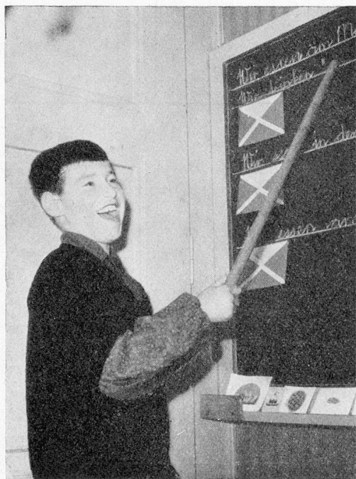
Frohgemutes Lernen in der Taubstumm- anstalt Wabern

Eine allgemeine Lohnerhöhung ist auf 1. 1. 1965 vorgesehen. Für Lehrkräfte wird eine unabhängige Neuregelung getroffen.