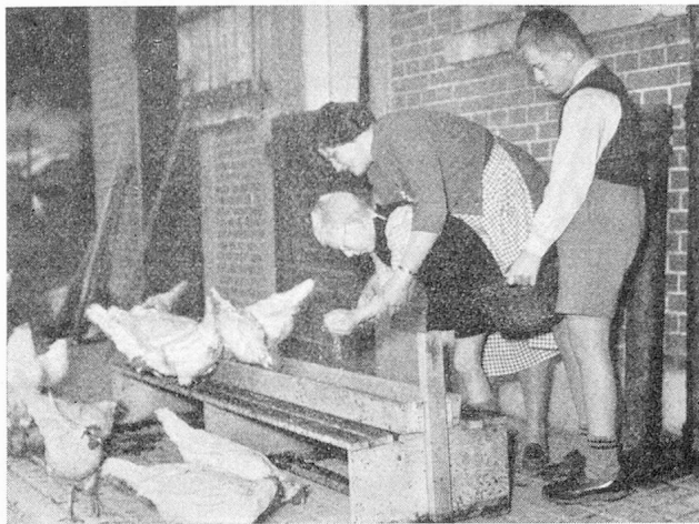
Beim Hühnerfüttern im Lukashaus in Grabs