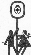
Kinderdorf Pestalozzi Trogen

Im Rahmen der Neugestaltung der Leitungsorganisation wird die neugeschaffene Stelle eines