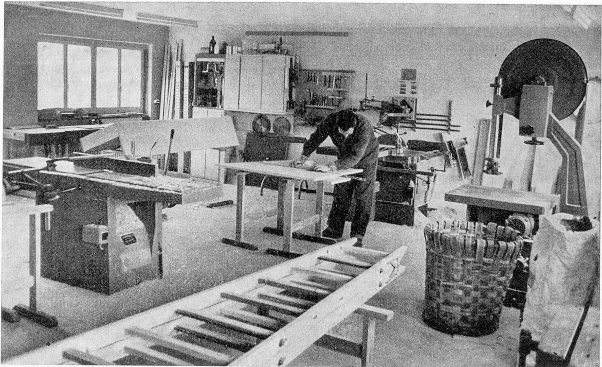
In der Schreinerwerkstatt

Der Landwirtschaftsbetrieb mit den vielen Tieren ist auch für die Kinder der Patienten ein interessantes und überaus beliebtes Tummelfeld und erleichtert die persönlichen Beziehungen zur Familie ungemein. Die Kinder kommen immer gerne nach Ellikon. Die Atmosphäre im Heim ist frei und gelöst, das Heim stets offen, und alle Patienten schätzen das Leben in der Geborgenheit einer Grossfamilie.