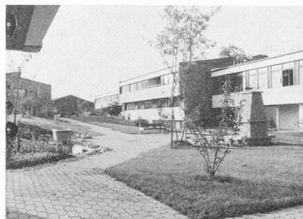
Das Hauptgebäude als zentraler Kern der Gesamtanlage