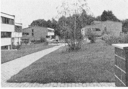
Das Hauptgebäude mit 2 Wohnpavillonen von Westen

Treppe versucht, jegliche Art von kasernenartigen Gängen auszu-schliessen. Die durchgehende Verwendung von Holzdecken in den Schlafräumen und die direkte Beziehung zwischen Garten und Wohnraum sollen Wohnlichkeit vermitteln. Man war bestrebt, neben der Erfüllung der betrieblichen Bedingungen durch die Architektur einen Rahmen zu schaffen, in dem es den Behinderten im Heim zur Platte richtig wohl sein kann.