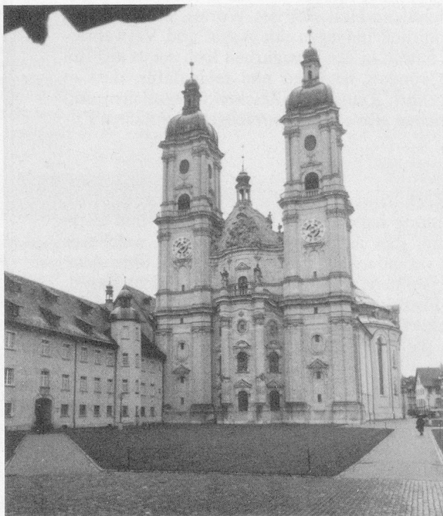
St. Gallens Wahrzeichen