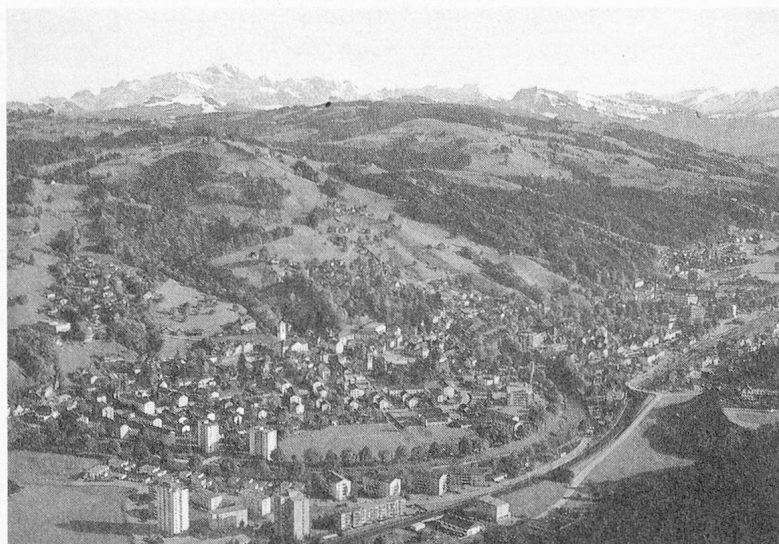
Flugaufnahme Wattwil im Toggenburg mit Säntis und Churfürsten

Ende dieses Monats treffen sich die Mitglieder des VSA im Toggenburg, in dem Land Ulrich Bräkers, zur Jahresversammlung 1983. Die Einladungen sind schon im vorigen Monat ergangen. Die Vorbereitungen sind abgeschlossen. Die gastgebende VSA-Sektion St. Gallen hat frühzeitig genug das schöne Wetter bestellt. Wohlan denn, Leute, kommet zuhauf! Wenn die Rechnung aufgeht und alles so wird, wie die Veranstalter es sich wünschen, wird sich der Tagungsort Wattwil im besten Frühlingschmuck zeigen.