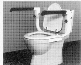
Messerli-Toilettenstütze Passend auf alle Toilettentypen, Armstützen beidseitig zum Hochklappen, höhenverstellbare Armlehnen, einfache Montage durch die bestehenden Sitzbrillenlochungen.