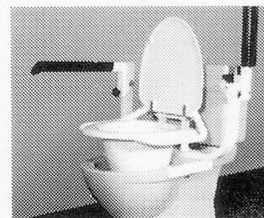
Messerli-Toilettenhilfe Ausführung wie Messerli-Toilettenstütze, jedoch Sitzhöhe in Stufen verstellbar bis 18 cm, einfache Montage durch die bestehenden Lochungen der Sitzbrille.