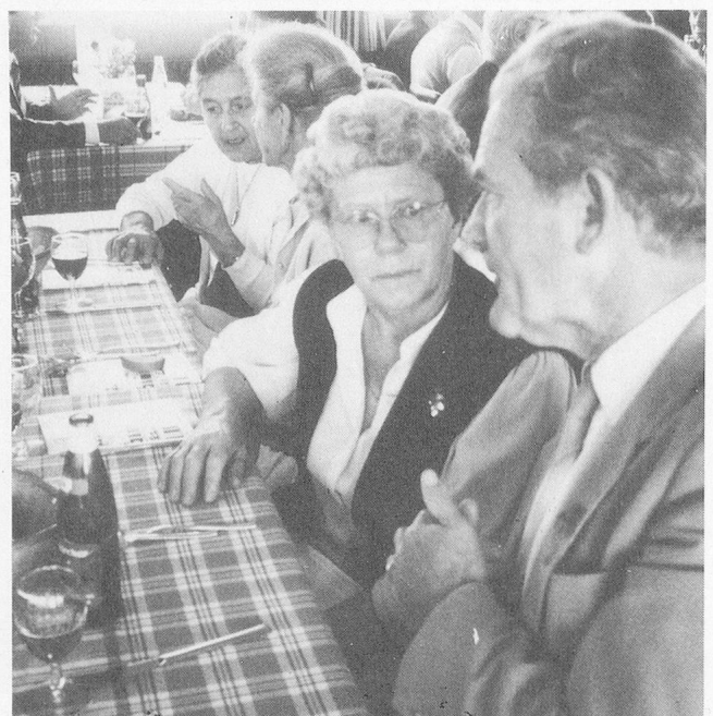
Tischgespräche: Unglaublich, aber wahr...