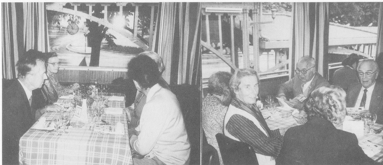
Pünktlich legt die «Unterwalden» in Luzern ab, die Seefahrt beginnt! Männiglich freut sich aufs Mittagessen: En Guete!

Das Wort «Veteran» ist militärischen Ursprungs und seit dem 18. Jahrhundert gebräuchlich. Das Wörterbuch sagt kurz und bündig: «im Dienst ergrauter, bewährter Soldat». Den Soldaten kann man hier gewiss vergessen. Aber unbestritten ist, dass, wo die berufliche Arbeit mehr als Dienst und weniger als Job verstanden wird, Bewährung, Tüchtigkeit, Dauer und Ausdauer dazugehören; sicherlich auch die Fähigkeit, sich einer Aufgabe unterzuordnen, und der Wille zur Treue. Auch in Zukunft werden die Heime auf Leute angewiesen sein, welche bereit sind, in ihrer Arbeit einen Auftrag zu sehen, zu dessen Erfüllung es den Mut zur Ausdauer braucht. Auch im Heim der Zukunft werden Menschen gebraucht, die den Mut aufbringen, treu zu sein und Veteranen zu werden.