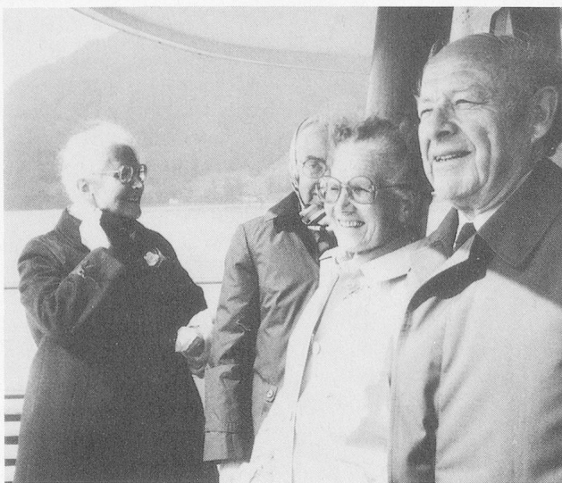
Ende gut – alles gut: Sie halten Ausschau auf das Reiseziel im nächsten Herbst.