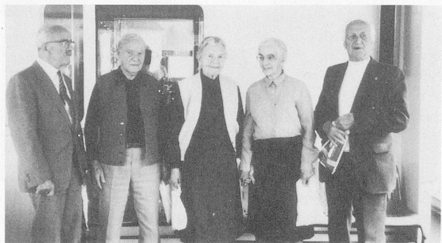
Auf der «Rangliste» der Lebensjahre stehen diese Veteranen an der Spitze und werden verdienstweise geehrt.