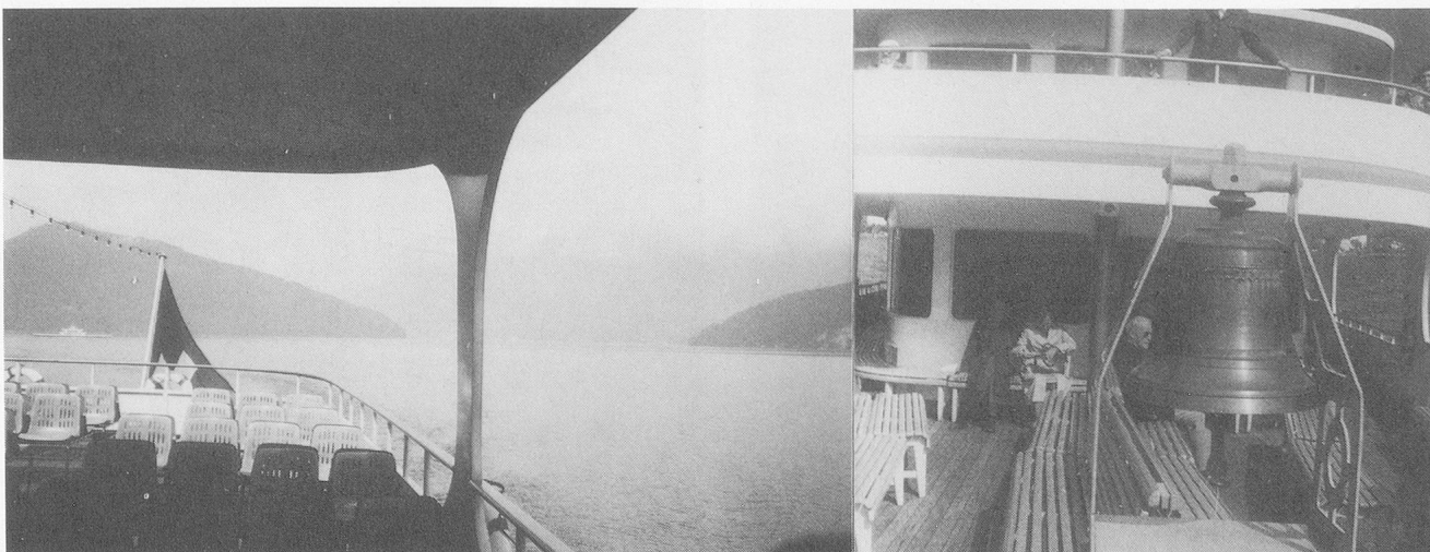
Unterwegs nach Gersau: Erst ist Grau die vorherrschende Farbe, aber dann beginnt sich der Nebel langsam zu lichten, man wagt es, draussen nach der Sonne Ausschau zu halten.

Der VSA wäre jedenfalls nicht, was er ist, wenn es in seinen Reihen die Veteranen nicht gäbe. Er hätte 1984 in Brugg nicht das Jubiläum des 140jährigen Bestehens feiern können, wenn ihm Tüchtigkeit, Ausdauer und Treue nichts gälten und wenn seinen Veteranen nicht seit jeher ein Ehrenplatz eingeräumt würde. Treue zum Betreuten kommt auch in Zukunft vor Job-Rotation. Der Gedanke ist schön und behält seinen Wert über die Zufallskonstellationen des Alltags hinaus, dass die VSA-Mitglieder beim Erreichen des Pensionsalters nicht einfach abtreten müssen und, von der Bildfläche verschwunden, schnell vergessen werden, sondern dass sie im Veteranenstand dem Verein und dem Heimwesen verbunden bleiben können, wenn sie wollen.