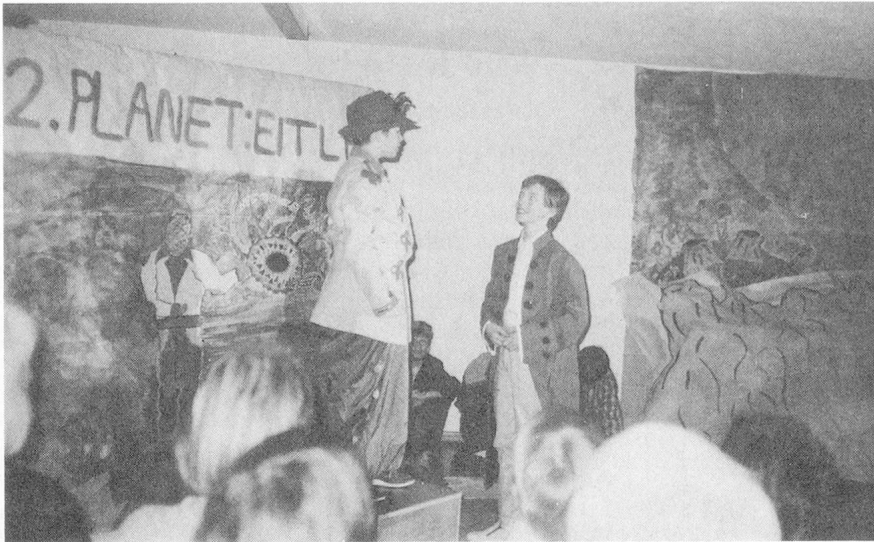
Saint-Exupéry's Kleiner Prinz kommt ins Kellertheater der Linthkolonie.