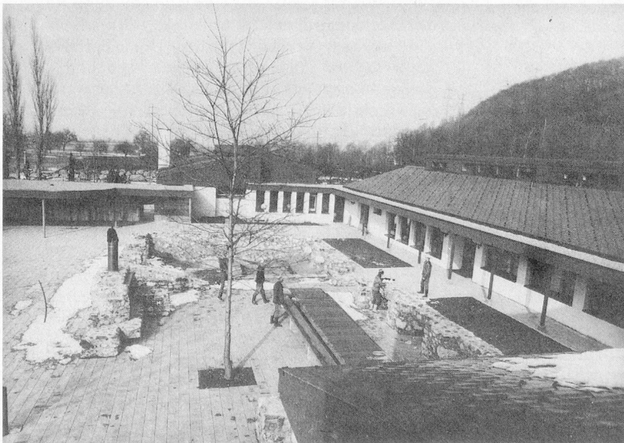
Der durch Abbruch des Altbaus gewonnene Platz ist schön ins Hofareal der Linthkolonie integriert.