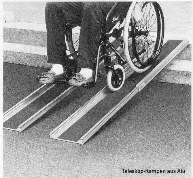
Teleskop-Rampen aus Alu