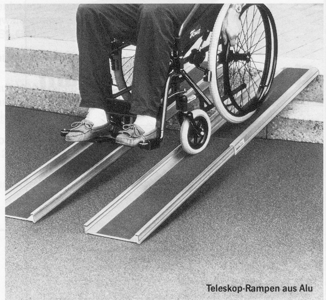
Teleskop-Rampen aus Alu