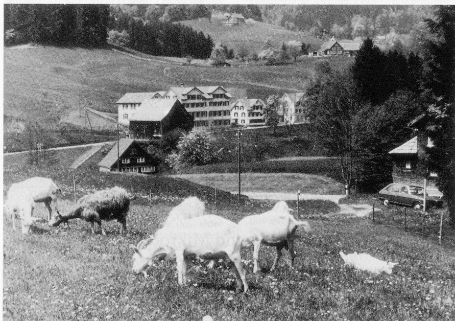
Nach einigen Jahren der Flaute ist heute die Zukunft des Ferienheims Schönenbühl im appenzellischen Wolfhalden gesichert. Heute wird Aufhalten im schmucken Doppelgiebelhaus (Mitte) wieder grosse Bedeutung beigemessen, zumal unzählige Begegnungen mit der Natur möglich sind.

aus ärmlichen Verhältnissen Ferien zu ermöglichen. Nachdem auch in der damaligen Gemeinde Töss mit Erfolg an die Wohltätigkeit und Gemeinnützigkeit appelliert worden war, konnte der neu ins Leben gerufene Ferienkolonieverein 1889 im Gasthaus «Wilhelm Tell» in Bauma eine erste Kolonie verwirklichen. 1896 wurden im «Landhaus» in Wattwil neue Unterkünfte gefunden. Nachdem aber auch hier keine dauerhafte Lösung möglich war, erhielt die Kommission den Auftrag, im Appenzellerland nach einem geeigneten Gebäude Ausschau zu halten.