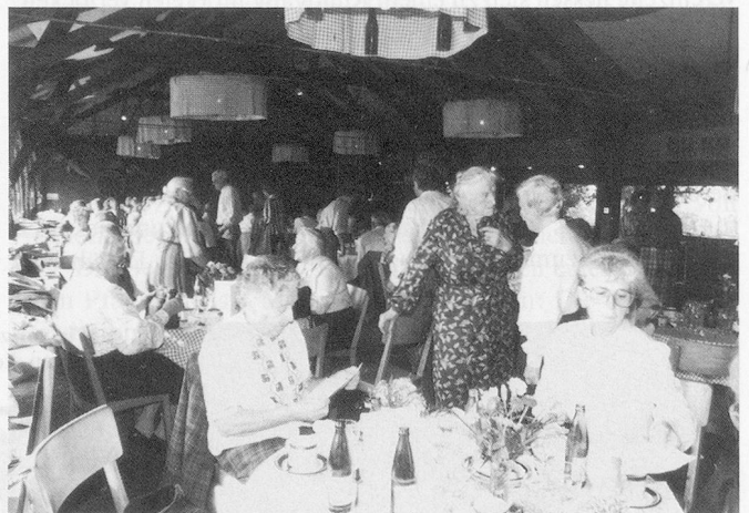
«Weisst Du noch?» Breiter Raum gehörte dem Austausch von Erinnerungen.

dem dem stimmkräftigen Chor liess sich hören. Die Anwesenden verdankten den Kindern ihr Konzert mit verdientem, herzlichem Applaus.