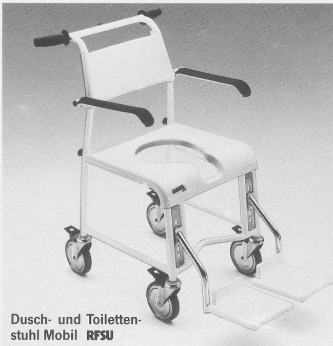
Dusch- und Toilettenstuhl Mobil RFSU

Unter dem «Merkur»-Prinzip wird eine «intellektuelle Kräfteform» verstanden. Mit anderen Worten: In der zweiten Sieben-