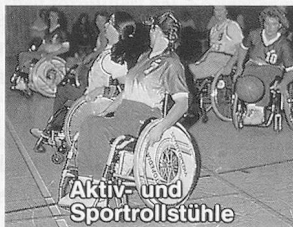
Aktiv- und Sportrollstühle