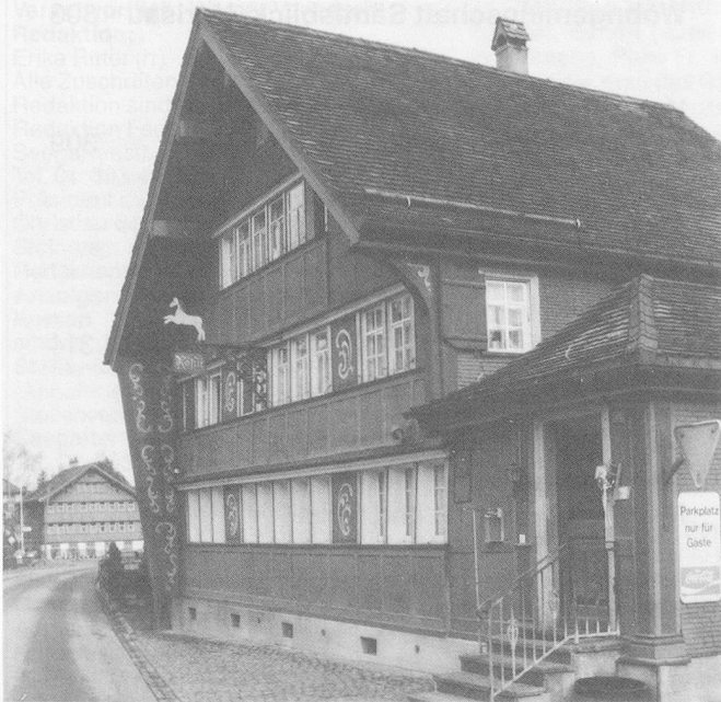
Tagungsort: Das Gasthaus Rössli zu Appenzell.