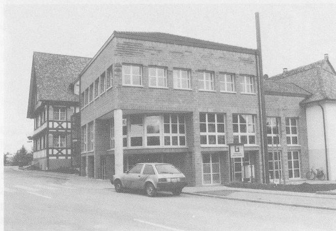
Ein neuer Begegnungsort: Das Zentrum Bären in Kreuzlingen.

Für die Pflege der Kameradschaft ist ein Frühlingsbummel, verbunden mit Kegeln und Jassen geplant. Im Herbst steht eine Betriebsbesichtigung auf dem Programm. Viel Platz nimmt die Herbsttagung der Altersheimleiter, die am 13./14. November