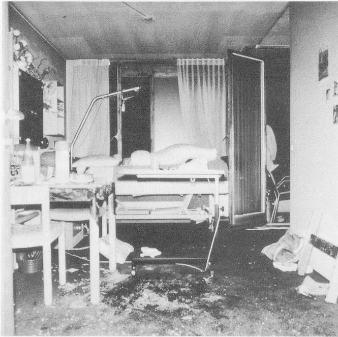
Aus dem Archiv der Berufsfeuerwehr Zürich: Das muss nicht sein!

Flammen. Das geht oft schneller, als sich's liest, nicht selten nahezu explosionsartig. Nach nur 7 bis 10 Sekunden flackert bloss noch schwach das nackte Baumgerippe, wenn nicht in der Zwischenzeit einige Haushaltgegenstände wie Gardinen, Postermöbel oder Teppiche in Brand geraten sind. Wer nach Wasser oder einer löschenden Decke eilt, kommt dann leicht zu spät. Der Abbrand geht mit der Entwicklung eines kräftigen Überdruckes vor sich. Dabei entsteht eine gewaltige Druckwelle, welche selbst doppelt verglaste Fenster zu sprengen und Türen aus dem Rahmen zu schleudern vermag. Bei einer «Christbaum-Explosion» in Zürich war die Druckwelle so wuchtig, dass sie, nachdem sie die Türe zum angrenzenden Zimmer aus der Füllung gesprengt hatte, fast die ganze doppelwandige Trennmauer zur Nachbarwohnung zum Einsturz brachte. Das anwesende Ehepaar überstand die Explosion relativ unbeschadet, erlitt dann aber bei den Lösversuchen ziemliche Verbrennungen, was die Überführung ins Waidspital nötig machte.