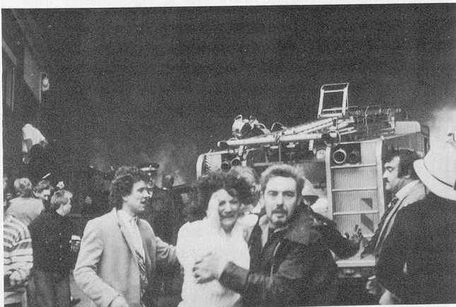
Panik in einem Fussballstadion, 56 Tote, über 300 z. T. Schwerverletzte.

Um zirka 21.00 Uhr verlassen die letzten Besucher das Krankenhaus. In einem Viererzimmer ist einer der Patienten ein starker Raucher. Weil das Rauchen im Bett nicht gestattet ist, versteckt er ein Päckchen unter dem Kopfkissen. Den Patienten werden, wie üblich in Krankenhäusern, Schlafmittel verabreicht, damit sie leichter ein- und durchschlafen. Dies hat dann aber auch zur Folge, dass sie durch Vorgänge in ihrer Umgebung nicht so leicht geweckt werden, was bei einem Brandausbruch von Nachteil ist.