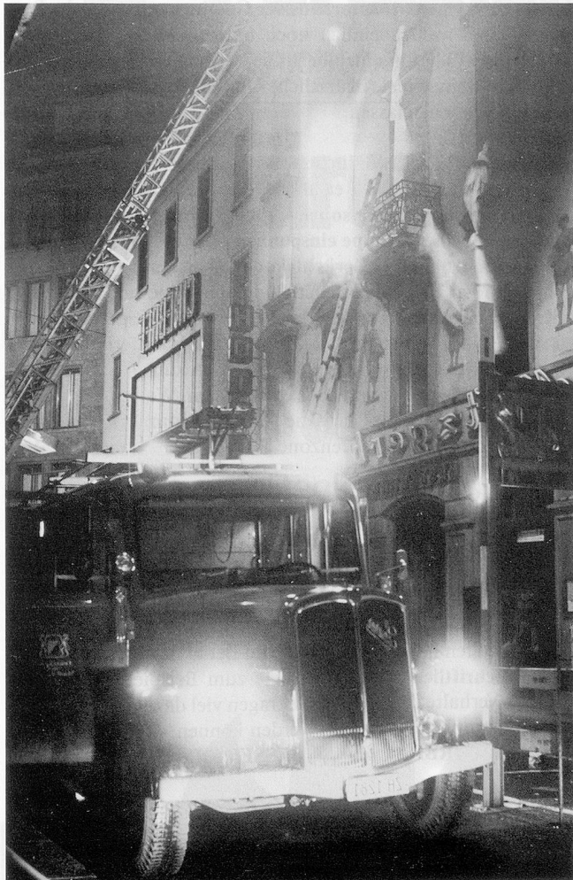
Flucht in Panik aus einem brennenden Hotel

Menschen und Tiere sind bestrebt, zu der drohenden Gefahr eine bestimmte Distanz zu wahren. Ist diese Entfernung zu klein, setzt die Fluchtbewegung ein. Je weiter man von der Gefahr entfernt ist, um so geringer wird diese eingeschätzt. Das ist der Grund dafür, dass Menschen nach ihrer Flucht oder Rettung zum Beispiel aus einem brennenden Haus plötzlich wieder in die Gefahrenzone zurückzukehren versuchen, um selbst Bergungs- oder Rettungsmaßnahmen durchzuführen. Ab einem gewissen Punkt überlagert die Wertvorstellung von einem in dem Gefahrenbereich zurückgelassenen Angehörigen oder Gut das sich abschwä-