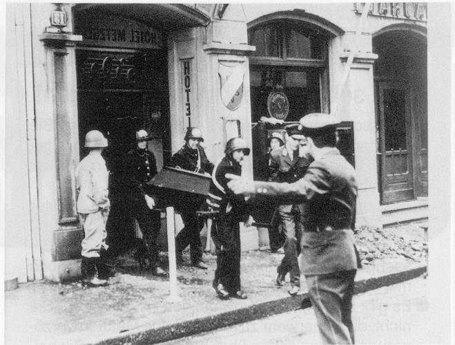
Diese Situation sollte unbedingt vermieden werden.