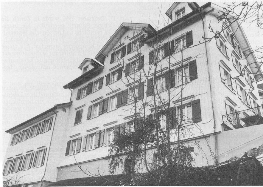
Mit der sorgfältigen Sanierung des Personalhauses hat das Ostschweizerische Wohn- und Altersheim für Gehörlose in Trogen AR eine weitere Aufwertung erfahren.