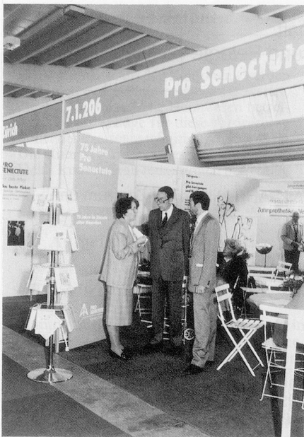
Informationsstand der Pro Senectute.