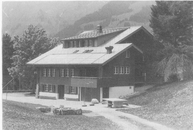
Sonnenenergie für das Ferienhaus «Marchgraben»: Energiespeicher im Haus; 38 Quadratmeter Solarzellen.

Vorher waren 26 kleine Holzöfen im Betrieb, erklärte Christian Schranz , der das Haus verwaltet. Eine Sanierung der Anlage hatte sich aufgedrängt, weil die kleinen Holzöfen in diesem alten Holzhaus eine nicht geringe Brandgefahr darstellten. Die Sonnenenergieanlage, die mit Sonnenkollektoren funktioniert, erzeugt Energie für die Heizung und das Warmwasser. Durch die Solarzellen (auf einer Fläche von 38 Quadratmetern) wird eine frostsichere Flüssigkeit aufgeheizt und die Energie in einem Boiler gespeichert. Fällt die Temperatur im Boiler unter 48 Grad, tritt automatisch der Ölbrenner in Aktion, was vor allem im Winter vorkommt. Im Sommer reicht die Energie aus der Sonne für die Warmwasseraufbereitung aus.