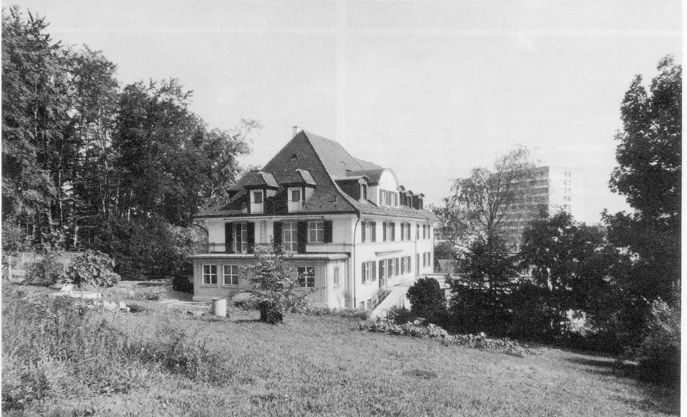
Die Beschäftigungsstätte Kästeli, Pratteln.

Heute sind heilpädagogische Tagesschulen, geschützte Werkstätten, Beschäftigungsstätten und Wohnheime für Behinderte Institutionen, welche wir uns nicht mehr wegdenken können. Doch noch vor wenigen Jahrzehnten war alles anders, auch im Kanton Baselland. Die Tatsache, dass es an gesetzlichen Grundlagen zur Förderung und Schulung geistig Behinderter fehlte, dass es an Institutionen für solche Kinder mangelte, zeigt nicht nur, dass das Vorhandensein behinderter Kinder noch nicht ins Bewusstsein der Öffentlichkeit gedrungen war, sondern auch, dass solche Kinder als minderwertige Menschen betrachtet wurden und Einzelfälle waren, um die sich die Eltern ohne jegliche finanzielle oder moralische Unterstützung selber kümmern mussten. So wurden diese Kinder oft in der Familie versteckt gehalten und genossen deshalb meistens auch keinerlei Schulbildung. Heute weiss man, dass bei frühzeitiger Erfassung geistig behinderte Kinder in erstaunlichem Masse gefördert werden können. Je nach Einteilungsart rechnet man mit einem bis drei Prozent von geistig Behinderten unter den Kindern.