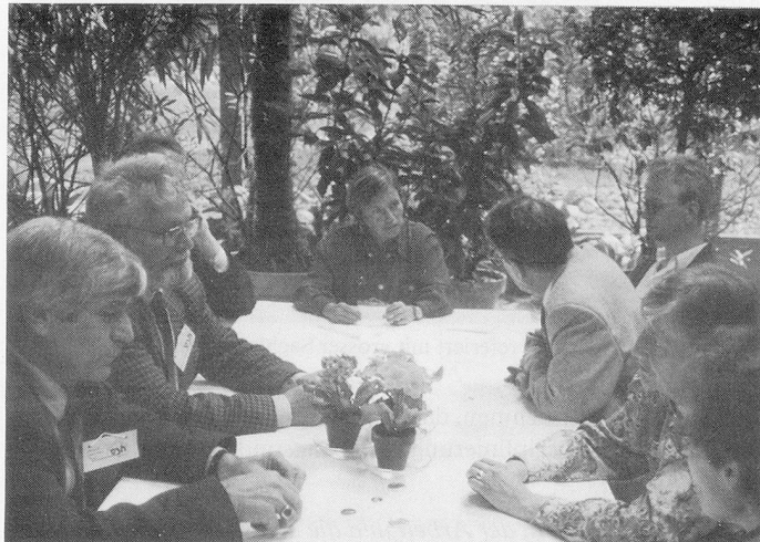
Ein Kaffee vor Tagungsbeginn befreit die Gemüter; kleine Diskussionsgruppen fördern die Kollegialität und verhelfen zu erfreulichen Fachgesprächen.