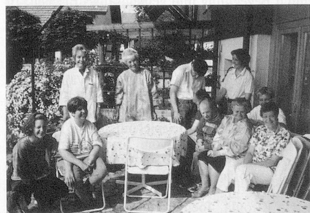
Gruppenbild: fast die gesamte Equipe der Alten Schmitte. So bodenständig wie der Alltag der Menschen, die hier leben – die Alte Schmitte im Dorfkern Lohns.