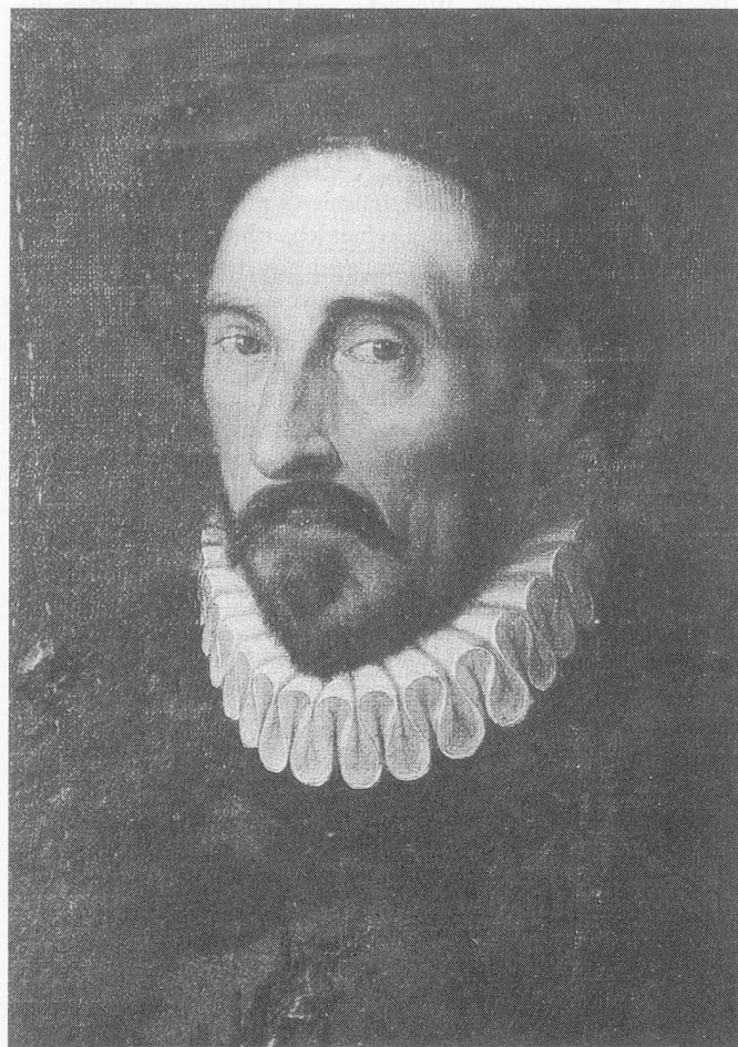
Michel de Montaigne.

Die Menschen schauen immer aufs Gegenüber. Ich aber wende meinen Blick nach innen, binde und beschäftige ihn da. Jedermann schaut geradeaus, ich aber in mich hinein. Nur mit mir habe ich's zu tun. Ich betrachte mich unaufhörlich, überwache mich, probiere mich aus. Die anderen drängen immer nach aussen, ich aber kreise in mir selbst.