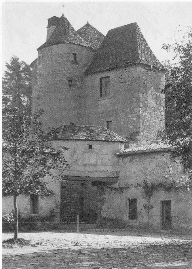
Château de Montaigne.

Wenn ich mit einer Katze spiele, wer weiss denn, ob nicht sie sich die Zeit eher mit mir vertreibt, als ich mir ihr?