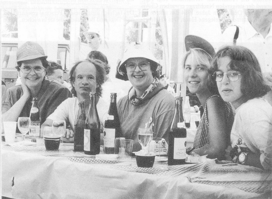
Junge Sportler und Sportlerinnen freuen sich über die herzliche Begegnung mit Bundesrätin Ruth Dreifuss.

hindertensport (SVBS) beteiligten sich am 32. Sporttag. Auch dieses Jahr war der Grossanlass ein Festival des Breitensports, der mit seiner Vielfalt an Disziplinen allen und damit auch schwerstbehinderten Rollstuhlpatienten das aktive Mitmachen ermöglichte. Zwischen den Leichtathletik- und Mannschaftswettkämpfen wurde gerne die Möglichkeit wahrgenommen, in der Festwirtschaft Bekannte zu treffen und alte Freundschaften neu aufleben zu lassen. Der Schweizerische Sporttag 1994 wird am 3. Juli stattfinden.