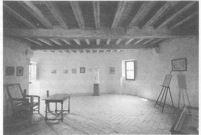
Die Bibliothek im Turm des Schlosses.

Gerade die Essays sind Beispiele dafür, wie die innere Dynamik wirkt und überraschende Ergebnisse hervorbringt. Diese geistige Lebendigkeit spiegelt sich auch in der Entstehungsgeschichte: Sie erscheinen zuerst in zwei Büchern, dann erweitert auf drei mit rund sechshundert Ergänzungen und nach Montaignes Tod mit