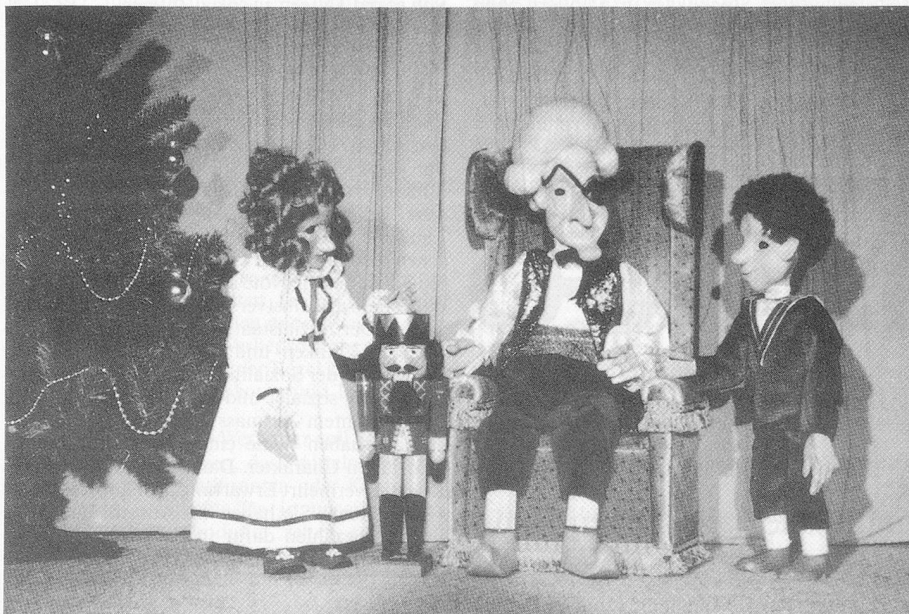
Szenenbild aus der Marionetten-Produktion «Nussknacker»