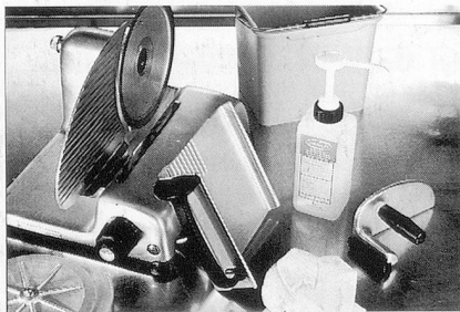
Sumanet, Sumabac, Sumarein: Alles für hygienisch-saubere Küchenmaschinen.