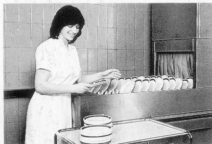
Glänzendes Ergebnis beim Geschirr: Sumazon und Sumabrite.