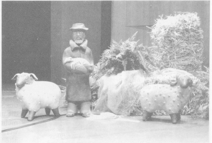
Allerliebste Dekorationen: Marionetten und Keramikfiguren erzielten mit wenig Aufwand eine starke Wirkung.

Thun ist immer eine Reise wert. Geniessen Sie diese Stadt mit ihren Kunstdenkmälern, verbunden mit der angestrebten Weiterbildung, dann werden Sie beim Abschied mit Freuden sagen: ‚Uf Wiederluege‘ und das auch im Sinne einer gleichberechtigten Zusammenarbeit zwischen Heimverband Schweiz und dem Verein Bernischer Alterseinrichtungen.›