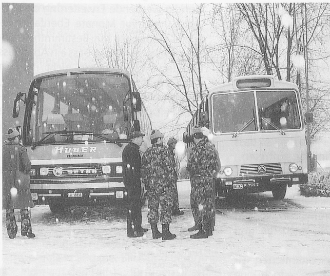
März 1993: Rollstuhlar und Nostalgiebus der Schweizer Armee stehen für den Ausflug bereit – bei Schneegestöber ...

Viele Pensionäre finden sich nicht ohne weiteres in den neuen Gefilden zurecht. Andauernde Motivation und viel Zeit zur Begleitung sind nötig. Gute Beschriftung aller Räume und Anlagen hilft viel mit. An jede Zimmertüre hängten wir zusätzlich zu einem Namensschild einen persönlichen Gegenstand des Bewohners/der Bewohnerin, damit der Raum eher gefunden werden konnte. Als Bestandteil des Umzuges setzten wir eine Equipe des Zivilschutzes für die Einrichtung der Zimmer ein: Möbel schieben, Verkabelungen vornehmen, Bilder aufhängen. Sobald das geschehen war, fühlten sich die Betagten schon viel wohler. Der Fernseh- und Telefoninstallateur ist sehr rasch aufzubieten, damit die alten Gewohnheiten nicht allzulange aufgegeben werden müssen. Der Bestandteil an Pflege- und Betreuungspersonal ist zumindest anfänglich möglichst auszubauen. Viele Probleme können durch intensive Begleitung der BewohnerInnen schnell gelöst oder sogar vermieden werden.