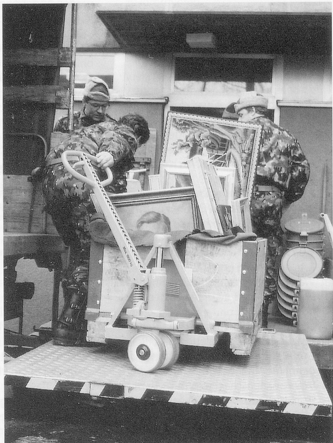
Ganze Palettenrahmen werden mit Bildern gefüllt.