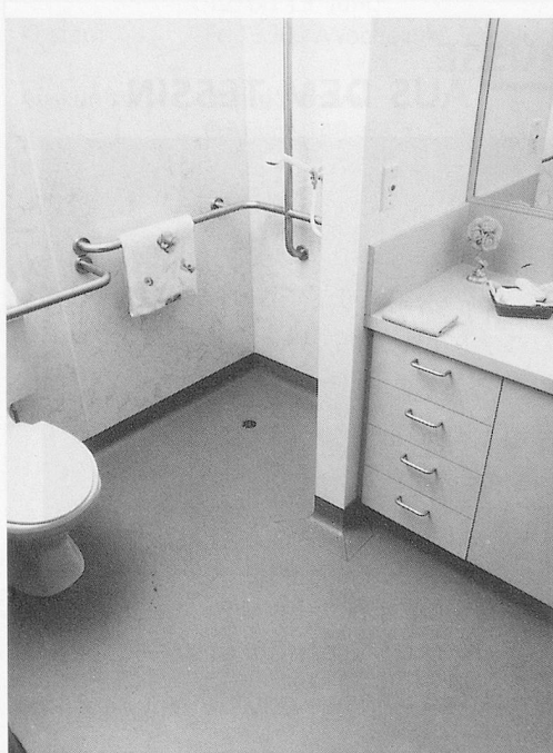
Ein hygienischer, rutschfester Boden. Ein Muss im Sanitärbereich.

Da der elastische Sicherheitsfußboden in zwei Meter breiten Rollen lieferbar ist, kommt man in den meisten Räumen mit relativ wenig Fugen aus. Die Stosskanten können miteinander verschweisst werden, so dass eine durchgehende Fläche ohne das Bakterienwachstum begünstigende Ritzen entsteht. Auch lässt sich das Material sehr gut ein Stück an der Wand hochziehen, wobei man durch die so gebildete Kehlung der schlecht zu säubernde Winkel zwischen dem Fussboden und der Wand entfällt.