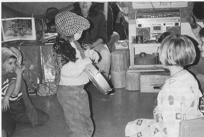
Das soziale Umfeld ist für ein Kind wichtig, auch der Kindergarten gehört dazu.

Im ersten Bereich sind die Sonderschulen zusammengefasst, im zweiten die Sonderschulheime. Durch das aktuelle angewandte WHO-Klassifikationssystem gelten in Frankreich heute weniger Kinder als geistig behindert als früher; ein Teil von ihnen wird seither in die Normalklassen integriert und gestützt, während die Zahl der Förderklassen am Abnehmen ist. Auf der Sekundarstufe sind aber diese Förderklassen in den letzten