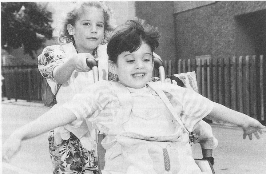
Die Vision einer Gesellschaft, in der kein Mensch ausgeschlossen ist. Fotos Forum «Kindergarten für alle»

Jahren verbessert worden. Seit einigen Jahren bestehen ferner Gesetze, welche die Integration erleichtern. An Integrationsformen setzen sich vor allem zwei Varianten durch: