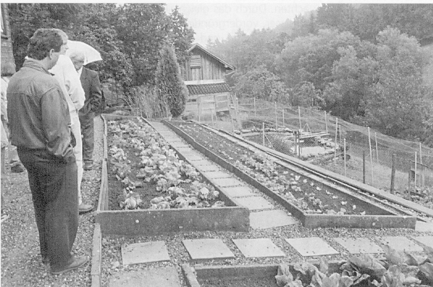
Arbeitstraining: Für das leistungsorientierte Programm steht unter anderem der Garten zur Verfügung.