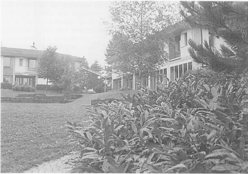
Das Lärchenheim: Eine Hausgruppe am Rande eines Abhangs, alte und neue Gebäude zum Beispiel, wie auf unserer Aufnahme.

hen. Wie es verschiedene persönliche und gesellschaftliche Hintergründe geben kann, die zur Drogenabhängigkeit führen können, braucht es auch verschiedene Behandlungsmöglichkeiten. Das Lärchenheim sieht sich als eine solche Möglichkeit an, die aber nicht den Anspruch erhebt, für alle Drogenabhängigen die richtige Lösung zu sein.