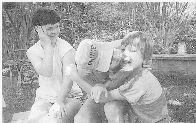
Einander annehmen: «Ich bin hier geborgen.»

Die Photoausstellung zum Buch kann von andern Institutionen gemietet werden. Sie ist leicht transportierbar. Die einzelnen Tafeln sind 50 cm breit und 180 cm hoch. Auskunft erteilt der Heimleiter, O. Wolfer, Heilpädagogisches Heim «Im Sunnehalb», 9655 Stein SG, Telefon 074 4 10 63.