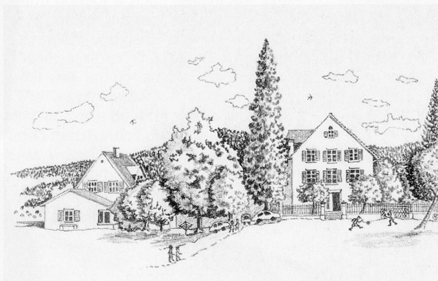
– 125 Jahre Weissenheim Bern – BSV/DPI-Mitteilungen