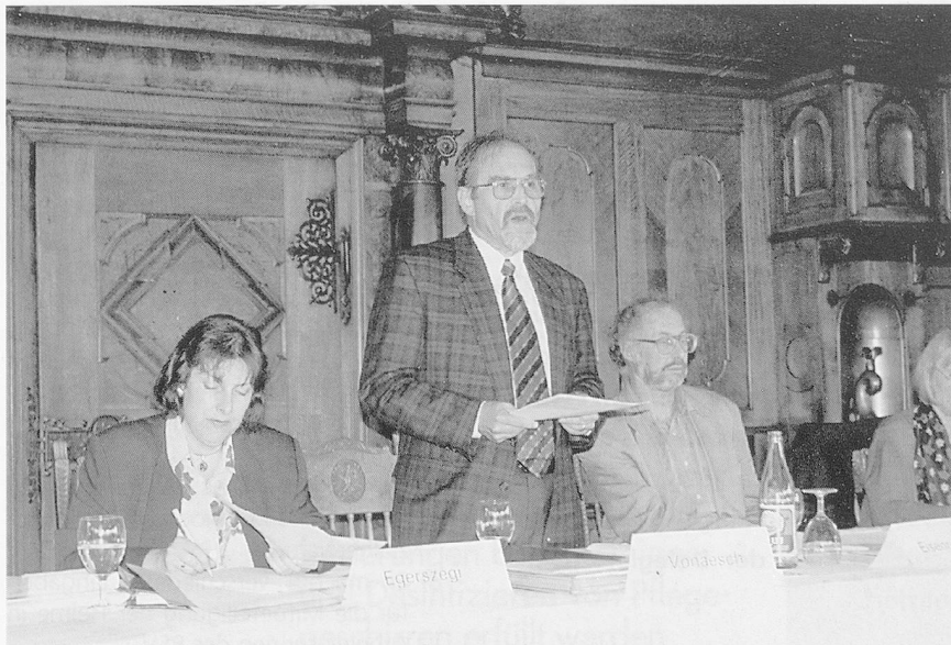
Der Heimverband hat ein reichbefruchtetes Jahr hinter sich.

rufsgruppen aufnehmen soll, ohne die Autonomie der angeschlossenen Verbände dabei zu tangieren.