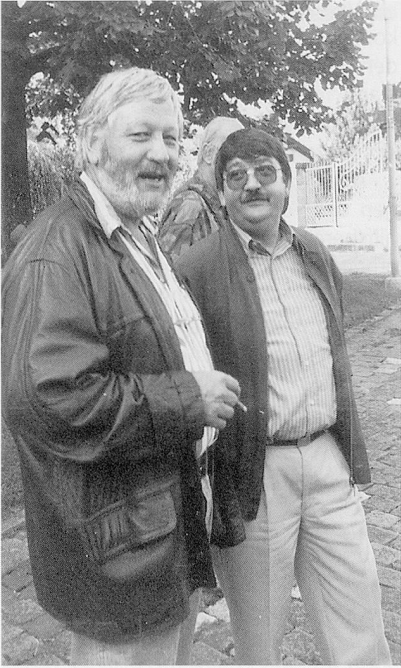
Als Kommissionspräsident zufrieden mit dem Produkt Fachzeitschrift Heim.