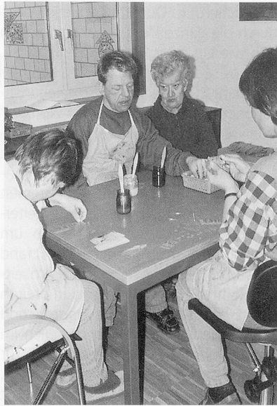
Ein Leitbild für die Arbeit mit erwachsenen Behinderten.

Gleich anschliessend folgte die Initiative von Marc Suter im Nationalrat, gemäss dieser die Rechte der Behinderten in der Bundesverfassung festgehalten werden sollen. Der Fachvorstand entschied sich für die Befürwortung der Initiative, obwohl nach Bundesverfassung ja alle Menschen die gleichen Rechte haben. Mit dem Festhalten der