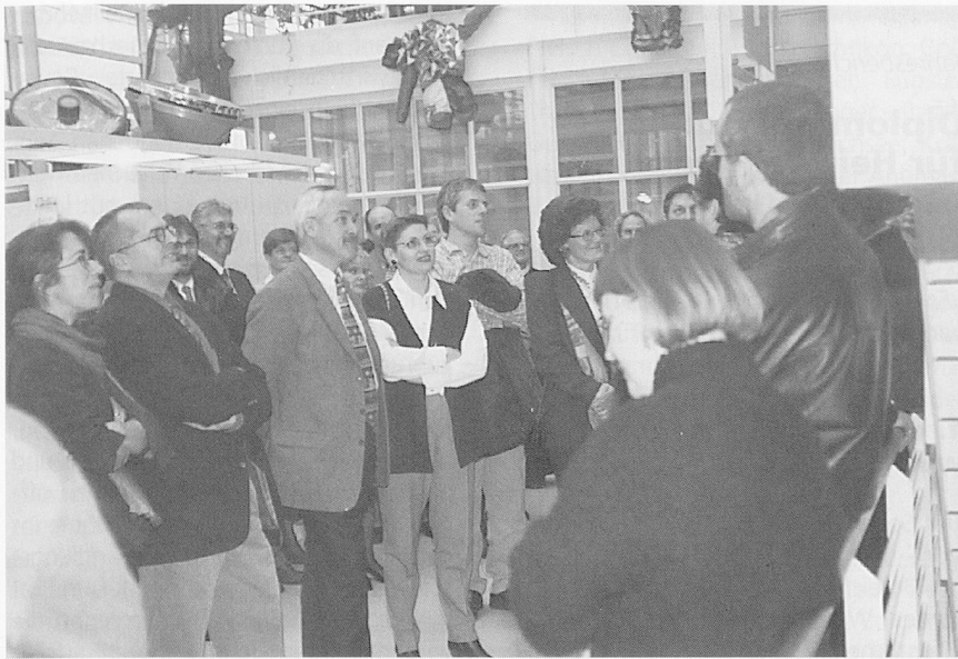
Weiterbildung und geselliger Austausch sind rege gefragt.