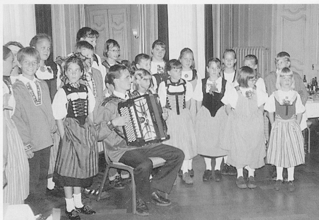
Rund 90 «Ehemalige» trafen sich in Langenthal, um zu plaudern und Neuigkeiten und Erinnerungen auszutauschen.