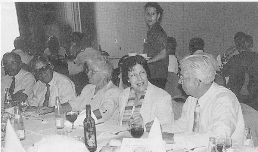
Auch Christine Egerszegy-Obrist war unter den Gästen im Hotel Bären in Langenthal anwesend.